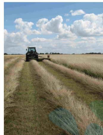
Fauche sur le plateau de Chabris

Cet indicateur présente les espaces gérés en faveur de la biodiversité en Centre-Val de Loire, leur nombre, leur superficie et leur part régionale.