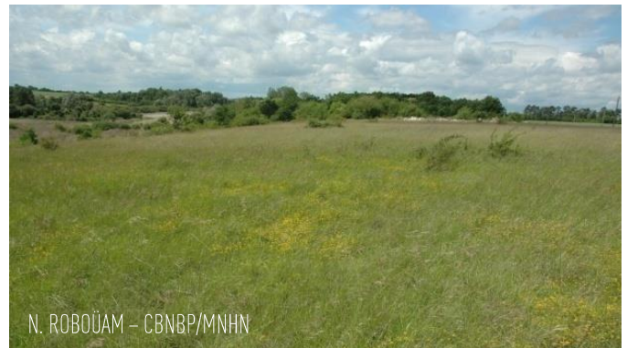
Pelouse sèche sur calcaire - Vallée de la Conie (28)

Par exemple, les pelouses sèches sur calcaire (photo ci-dessous) sont des habitats vulnérables en région Centre-Val de Loire.