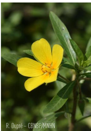
R. Dupré – CBNBP/MNHN

Cet indicateur présente le nombre d'EEE par catégorie et leur répartition sur le territoire.