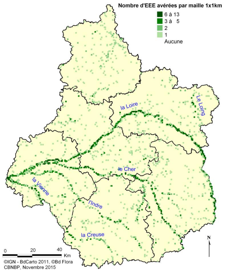
Densité de présence des EEE avérées par maille (1km x 1km) après 2000 - Situation en août 2015

Cette carte nous indique clairement que les EEE avérées se retrouvent majoritairement dans les vallées. Celles de la Loire, du Loing, du Cher, de la Vienne, de l'Indre et de la Creuse sont bien visibles sur la carte du fait d'un nombre d'EEE avérées par maille bien plus élevé qu'ailleurs.