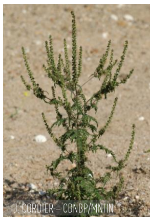
J. CORDIER – CBNBP/MNHN