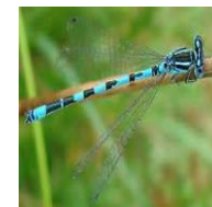
Agrion de mercure