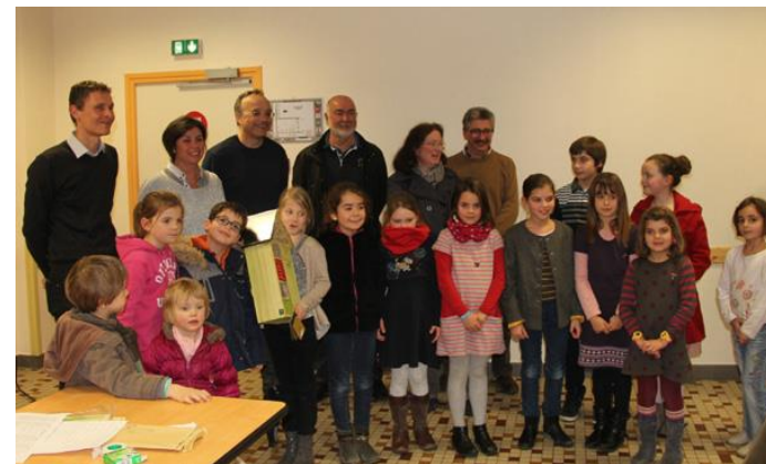
Lauréats du concours

→ ≈ 20 enfants et une classe ont participé au concours